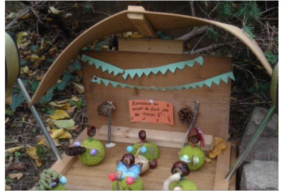
Parmi d'autres créations des Compagnons des Pavillons, le « concert de fruit-jazz des Maroon 5 »