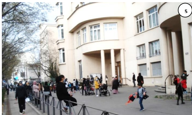
Photo 5 : le groupe scolaire Aristide-Briand, à l'heure de la sortie d'école.

Photo 4 : une dizaine d'affiches sur les rues du quartier proches de leur école sont exposées dans le hall de l'école.